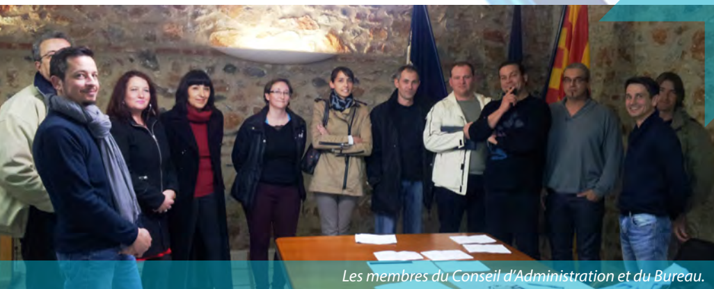
Les membres du Conseil d'Administration et du Bureau.

La municipalité espère et souhaite que de nombreux parents soient partie prenante du centre de loisirs. En effet si un plus grand nombre d'enfants y participent cela nous permettra de proposer des activités diverses plus importantes et pérenniser les emplois actuels voire même d'en créer de nouveaux. Nous comptons sur leur participation.