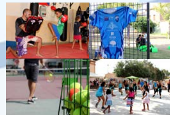
04 Septembre - Forum des Associations