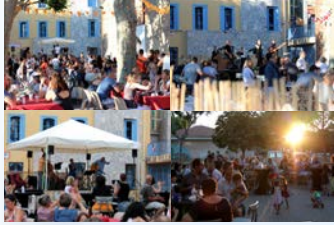
06/13/20/27 Juillet - Apéros concert