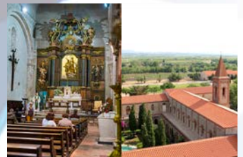
17/18 Septembre - Journées du Patrimoine