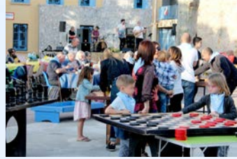
27 Mai - Fête des Voisins