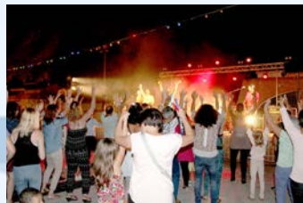
15 Août - Fête Locale