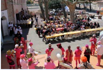
10 Avril - Fête du Printemps