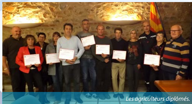
Les agriculteurs diplômés.

Vous apprenez également à utiliser un défibrillateur. Cette formation se déroule sur une journée et est payante. Ce diplôme peut permettre de sauver des vies en attendant les secours.