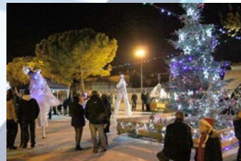
02 Décembre - L'illumination du Sapin de Noël