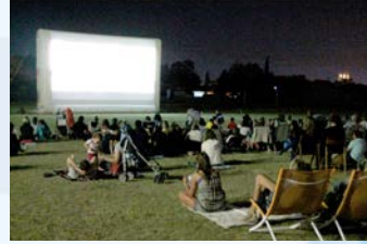
12 Août - Cinéma plein air