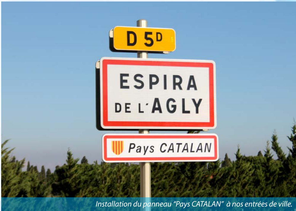
Installation du panneau "Pays CATALAN" à nos entrées de ville.

Espira de l'Agly n'a pas dérogé à la règle en emboîtant le pas de nombreuses communes du département en affichant son appartenance au Pays CATALAN.