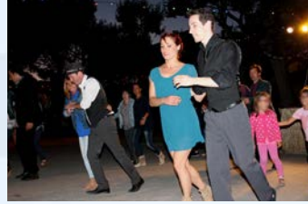
14 Juillet - Fête Nationale