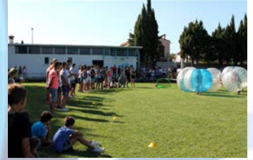
14 Août - Bubble Bump