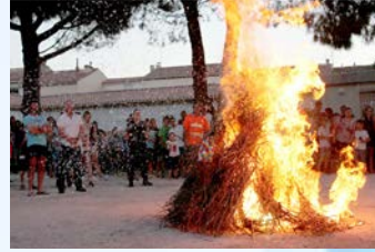
23 Juin - Fête de la Saint Jean