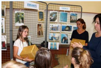
18 Septembre - Marathon Photo