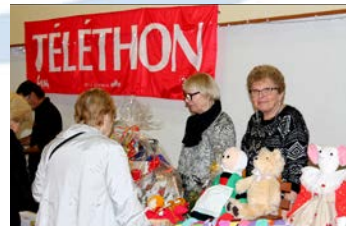
03 Décembre - Téléthon