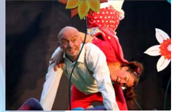
1er Juillet - Spectacle enfant