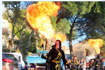
15 Octobre - Fête de la Châtaigne