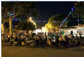
14 Août - Fête Locale