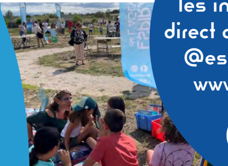
Fête de l'Environnement