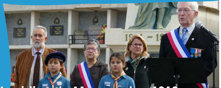
Armistice du 11 novembre 1918