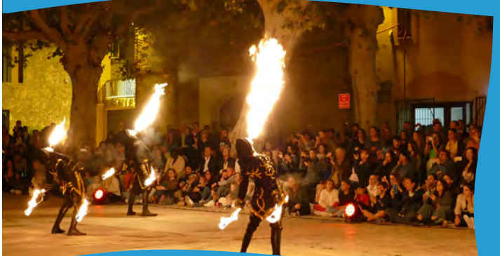
Fête de la Châtaigne