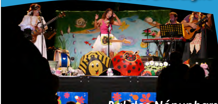
Bal des Nénuphors