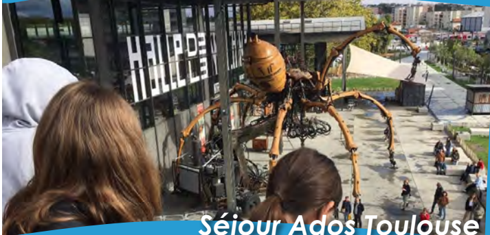
Séjour Ados Toulouse