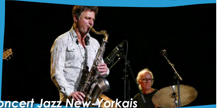
Concert Jazz New-Yorkais