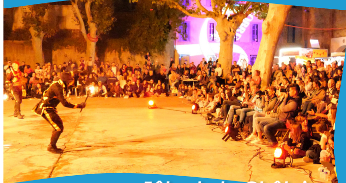
Fête de la Châtaigne