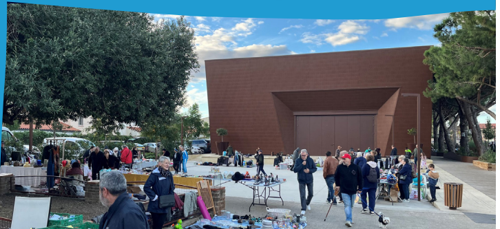
Fête de la Châtaigne - Vide Grenier