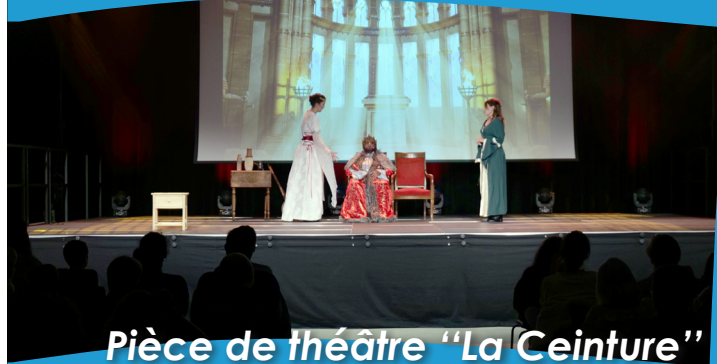
Pièce de théâtre "La Ceinture"