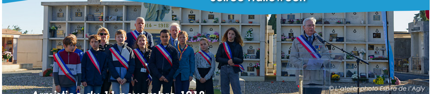
Armistice du 11 novembre 1918