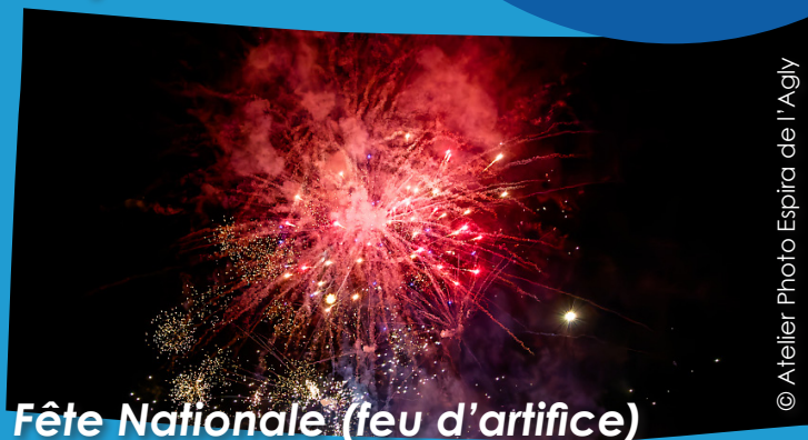
Fête Nationale (feu d'artifice)