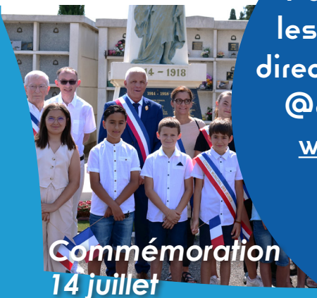
Commémoration 14 juillet

Pour suivre toutes les informations en direct abonnez-vous à @espiradelagly66 www.espira.com