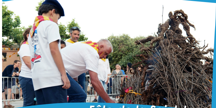
Fête de la Saint Jean