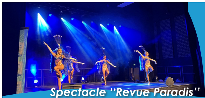
Spectacle "Revue Paradis"