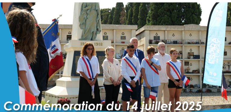
Commémoration du 14 juillet 2025