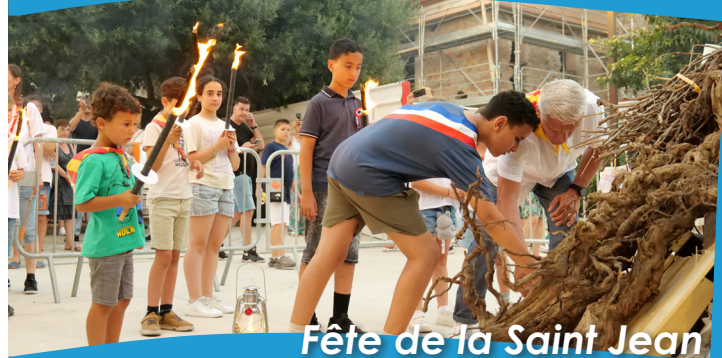
Fête de la Saint Jean