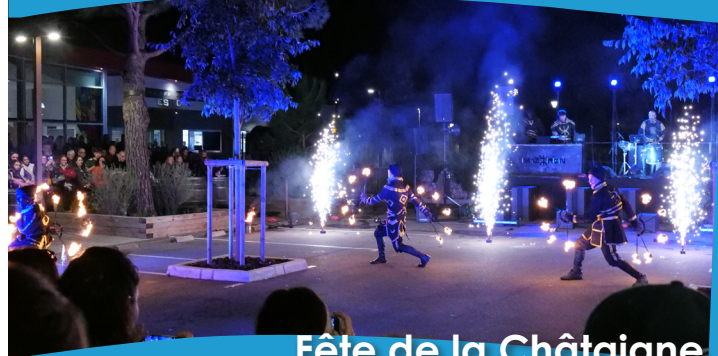
Fête de la Châtaigne