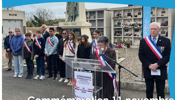
Commémoration 11 novembre